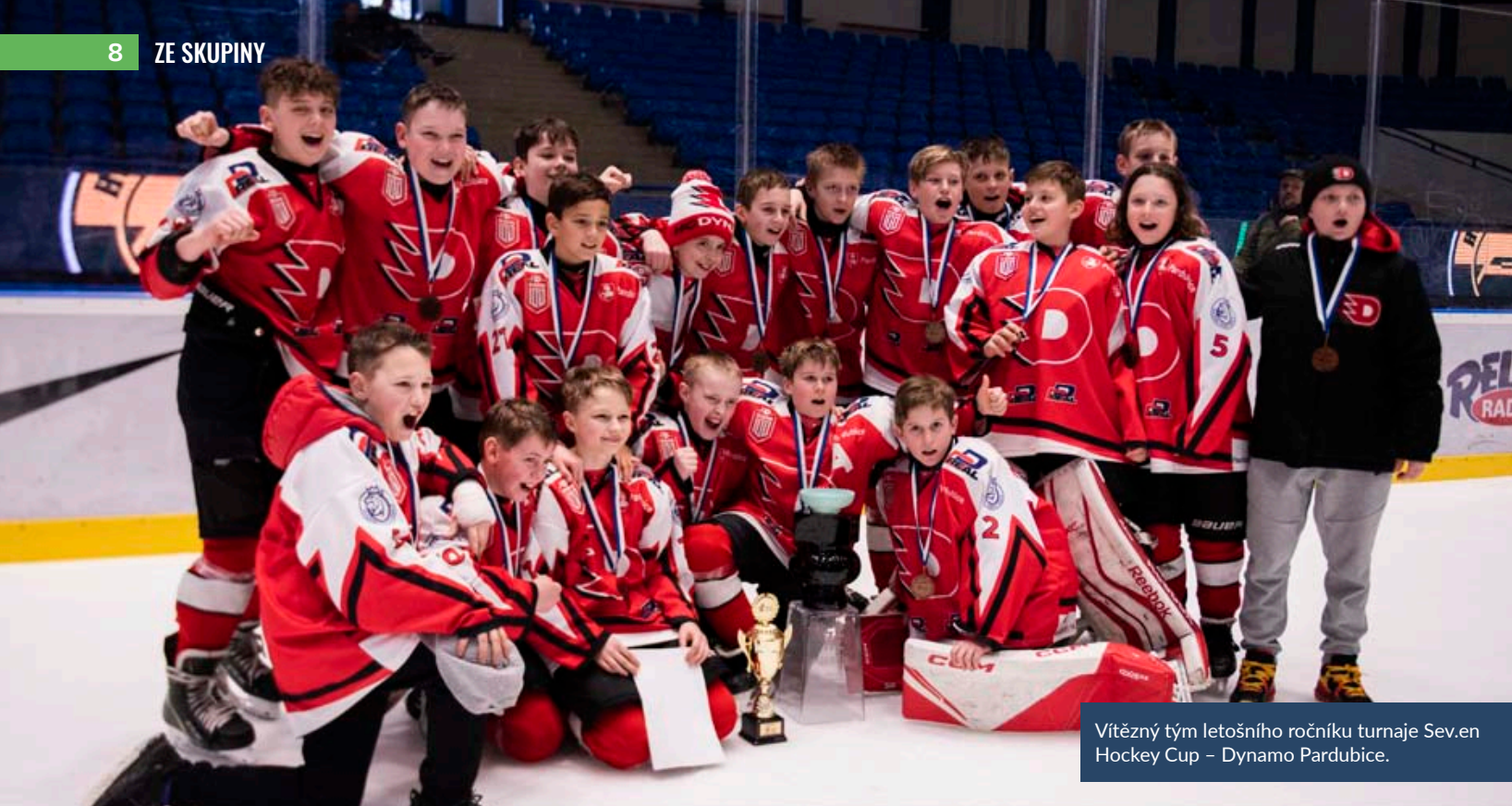
Vítězný tým letošního ročníku turnaje Sev.en Hockey Cup – Dynamo Pardubice.